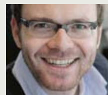
Claus Schäfer Mediengestalter

D er indische Königssohn Siddhartha und sein Weg zur Erleuchtung inspirierten schon Hermann Hesse zu seinem gleichnamigen Buch, wobei der Unterschied zu diesem äußerlich nicht größer sein könnte. »Mit den Augen Buddhas« ist vor allem ein üppiger Bildband, der im ersten Teil ausführlich anhand historischer Quellen ein Bild des Bodhisattvas zeichnet, illustriert von Tableaus und Reliefs aus verschiedensten Epochen, Regionen und Schulen des Buddhismus. Der zweite Teil nimmt den Leser mit auf eine Reise durchs heutige Indien, mal konkret, mal abstrakt entlang am Leben Siddharthas, begleitet von erläuternden Zitaten. Mit seinen zwei Zugängen, der eine informativ und biografisch, der andere meditativ und philosophisch, empfiehlt sich dieses Buch für alle, die sich über die bloßen Tatsachen hinaus dem Leben Siddharthas nähern möchten.